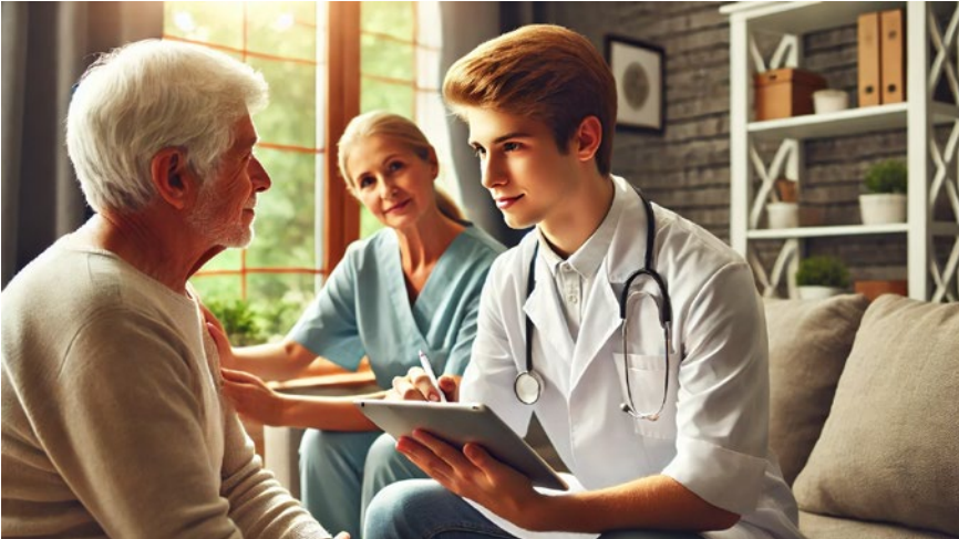
So stellt sich künstliche Intelligenz den Wissenstransfer bei der Spitex vor.

Wichtig ist, dass solche Innovationen nicht die persönliche Betreuung der Kundinnen und Kunden gefährden – die menschliche, persönliche Begegnung und Betreuung bildet seit jeher den Kern der ambulanten Pflege.